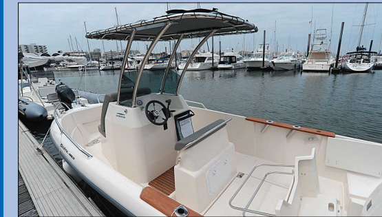
La partie centrale de la banquette arrière bascule vers l'avant afin de faciliter le relevage de la motorisation hors-bord.

Afin d'optimiser l'espace de circulation à bord, l'agencement du cockpit est modulable.