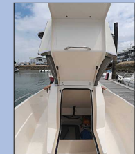
La petite plateforme de pilotage dispose d'un revêtement en teck. La cabine qui fait office de vaste rangement est accessible en soulevant l'assise placée devant la console.