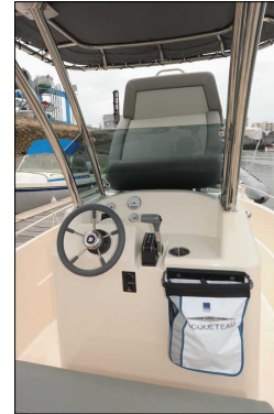
Un vide-poche bien pratique en toile fait partie de l'équipement du bateau.