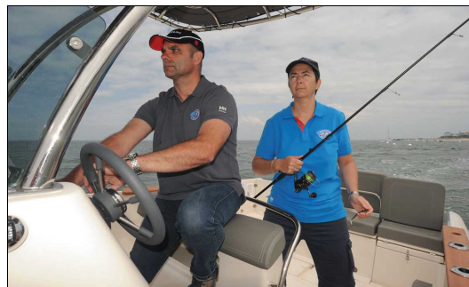
Le pilote profite d'une assise de type leaning-post confortable. Le pare-brise enveloppant est protecteur.