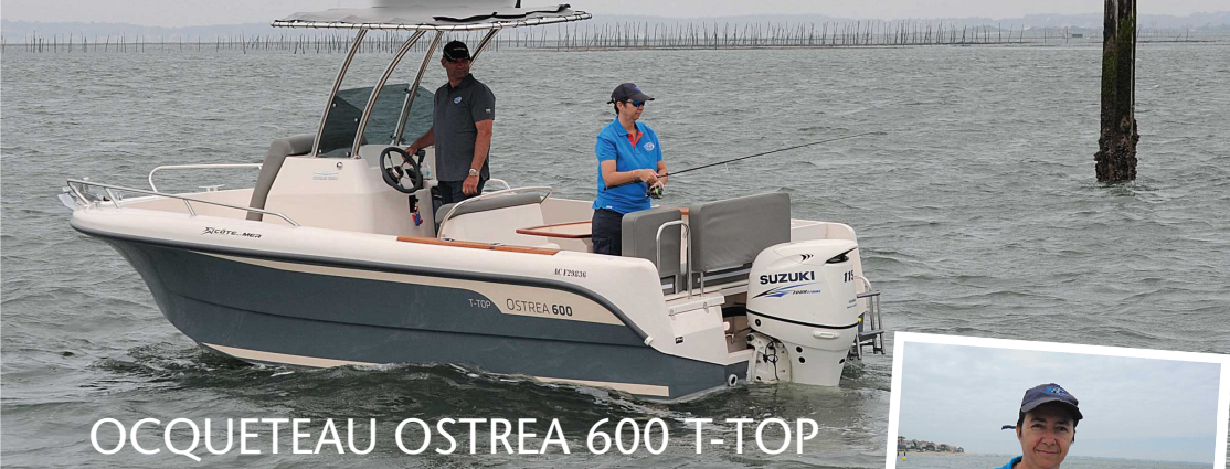
OCQUETEAU OSTREA 600 T-TOP